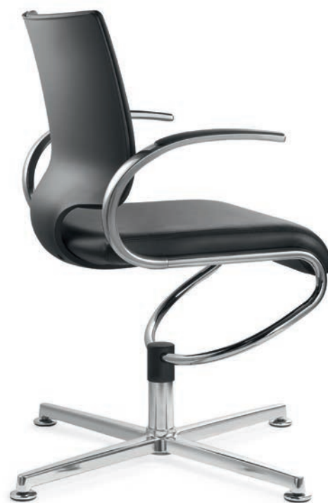
IT 5409 Manchetten (PU) | Armsteunen (PU) AA03KGS

Consequent klassiek. Het concept 'zwart' is klassiek mooi – en altijd weer stimulerend: de concentratie op het wezenlijke stelt vorm en functie centraal. De stoel is een echte blikvanger die de creativiteit echter alle ruimte geeft. De elegante, welvende armleuningen zorgen voor comfort en benadrukken tegelijkertijd de organische lijnen van de InTouch-bureaustoelen. De fijne designlijn van de bureaustoelen komt consequent terug in de conferentiestoelen.