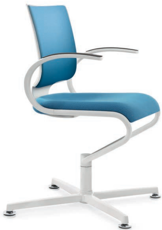
IT 5409 Manchettes (PU) | Armsteunen (PU) AA03KGS

InTouch volgt zowel met zijn driedelige zitschaal als met de op het lichaamsprofiel afgestemde rugleuning de bewegingen van de gebruiker en zorgt daarmee voor perfecte zitharmonie. Soepel en organisch steunt het elastische en flexibele Dauphin-zitsysteem het gehele houdings- en bewegingsapparaat voortdurend in direct contact met het lichaam. De white edition heeft een frisse, elegante uitstraling en laat ieder detail van het sierlijke design optimaal tot zijn recht komen.