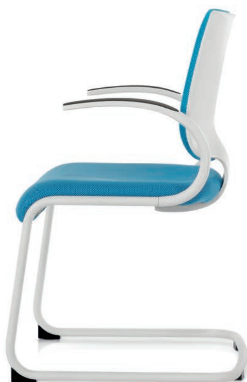
IT 5405 Manchettes (PU) | Armsteunen (PU) AA03KGS