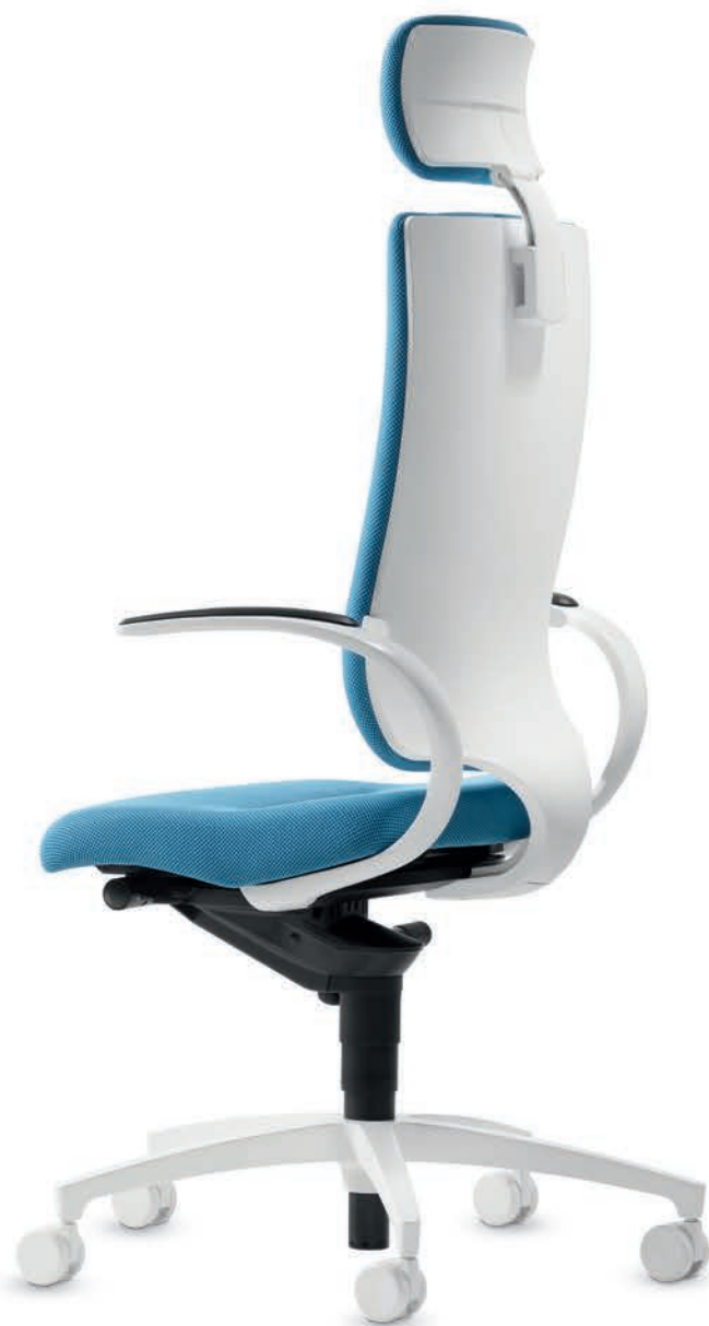
SD IT 5430 + Accoudoirs | Armleunigen AS13AVW