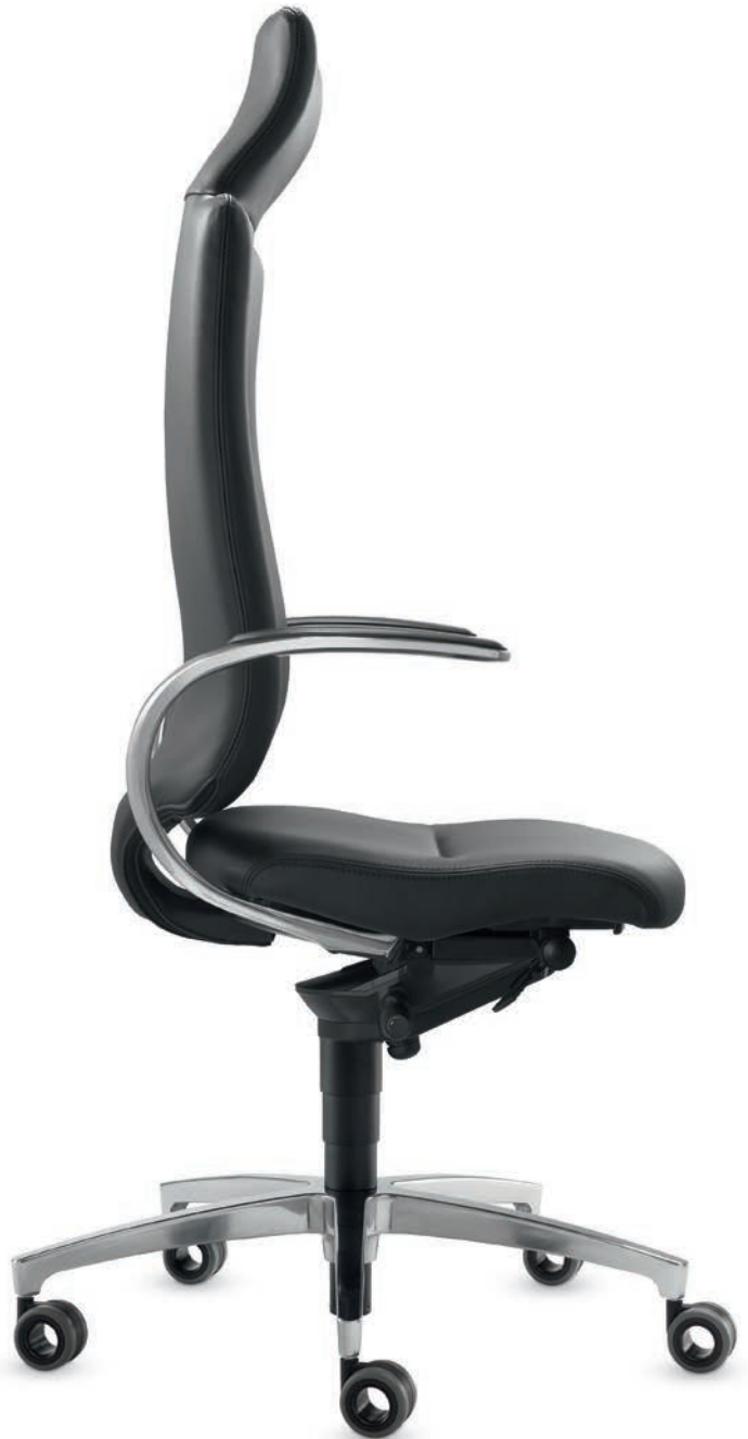
SD IT 5450 + Accoudoirs | Armleuningen AS14APO