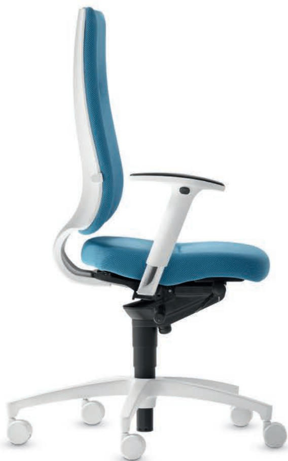
SD IT 5410 + Accoudoirs | Armleunigen A204APO