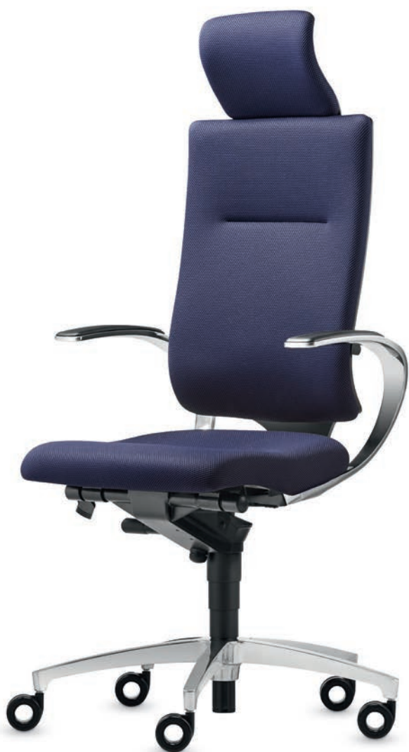
SD IT 5420 + Accoudoirs | Armleuningen AS13APO

Résolument classique. Le concept de design «noir» est élégamment classique et toujours attrayant: la concentration sur l'essentiel met la forme et la fonction au centre de l'intérêt. Le siège se distingue par son allure tout en laissant une large place à la créativité. Les accoudoirs en boucle confèrent un design très dynamique au siège tout en offrant un grand confort et soulignent la forme organique des sièges pivotants InTouch. Les sièges de conférence prennent résolument le relais de la ligne de design affinée définie par le siège de bureau pivotant.