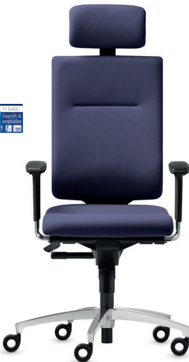
SD IT 5430 + Accoudoirs | Armleunigen A204APO