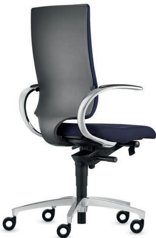
SD IT 5410 + Accoudoirs | Armleunigen AS13APO