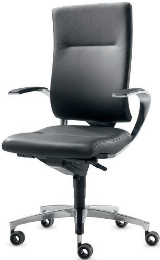
SD IT 5440 + Accoudoirs | Armleuningen AS14APO