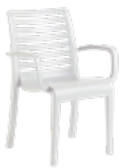
Blanc Glacier U6 301 096