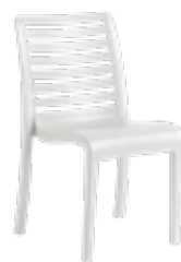
Blanc Glacier U6 401 096