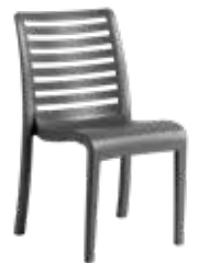
Anthracite U6 401 002