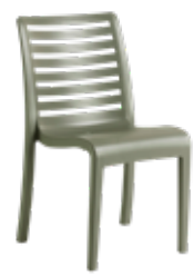
Forest Green U6 401 818

Conforme aux normes européennes EN 581 1/2/3 : produit testé en sécurité, résistance et stabilité pour un usage collectif.