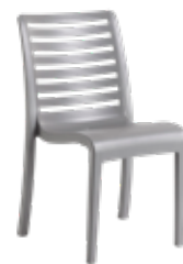
Gris Platinum U6 401 289