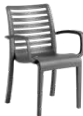
Anthracite U6 301 002