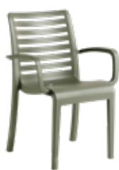
Forest Green U6 301 818