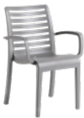
Gris Platinum U6 301 289