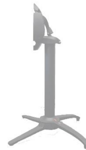
Aluminium U0 401 009