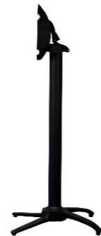
Noir U0 501 017