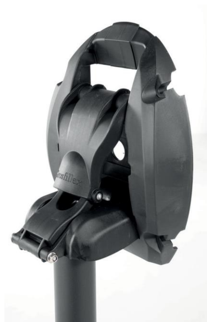
Grosfillex system : blocage de sécurité en ouverture & fermeture