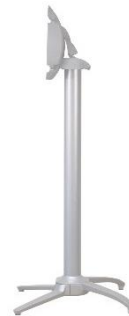
Aluminium U0 501 009