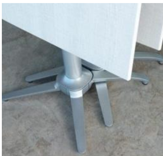
Pied en aluminium laqué, encastrable & rabattable