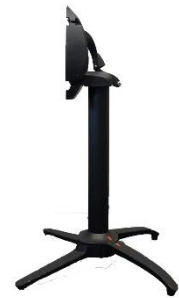
Noir U0 401 017