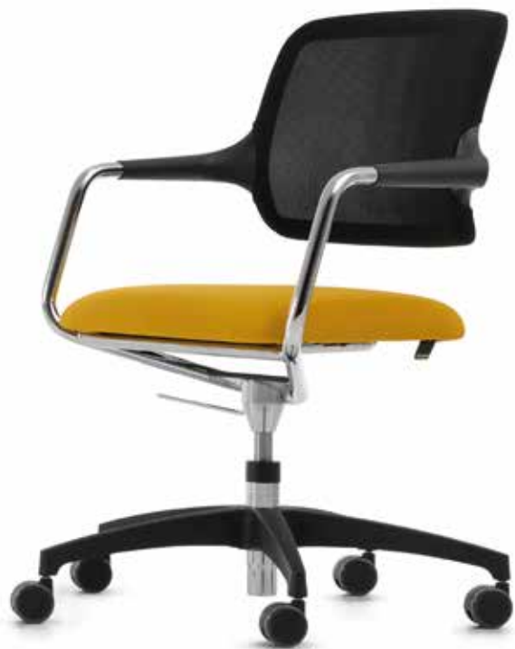
KO 5847 mesh Accoudoirs | Armleuningen AA01KGS