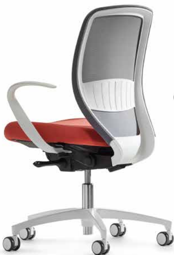
QS KO 5845 mesh + Accoudoirs | Armleuningen A106KVV

De organische vormtaal van de stoel wordt in de armleuningen elegant voortgezet - zo straalt Kick-off een aangenaam huiselijke sfeer uit, die in kantoren vaak ontbreekt. Syncro-Quickshift® is een bijzonder gebruiksvriendelijke techniek, die perfect geschikt is voor flexwerkplekken.