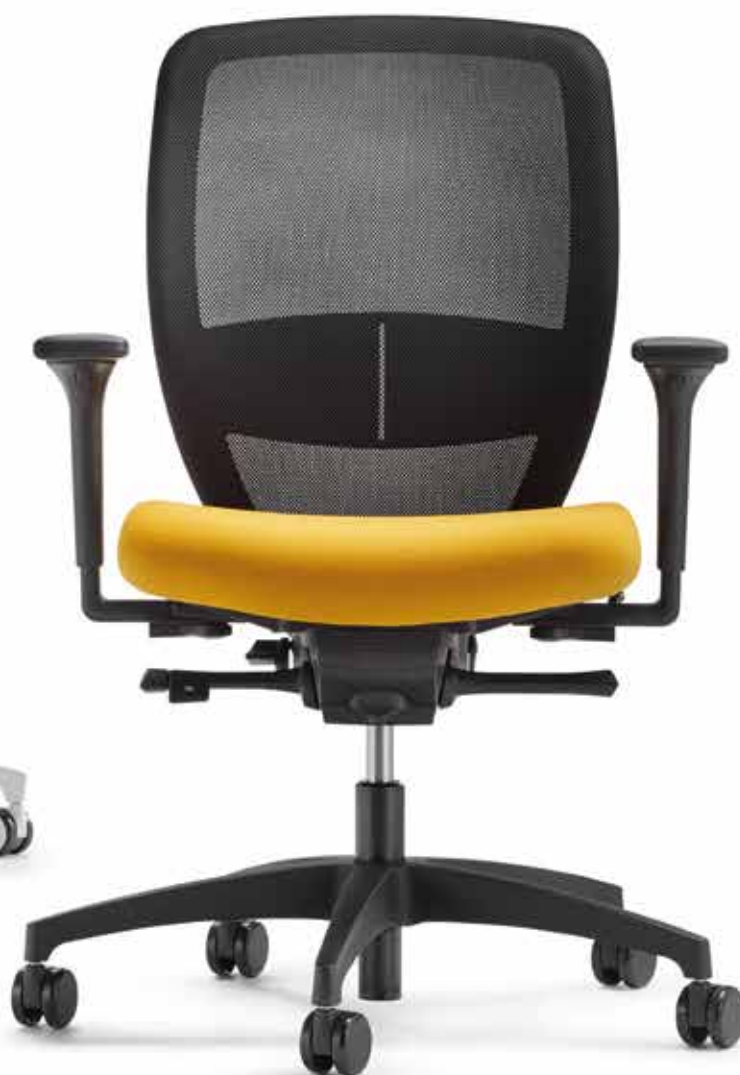
QS KO 5845 mesh + Accoudoirs | Armleuningen A341KGS