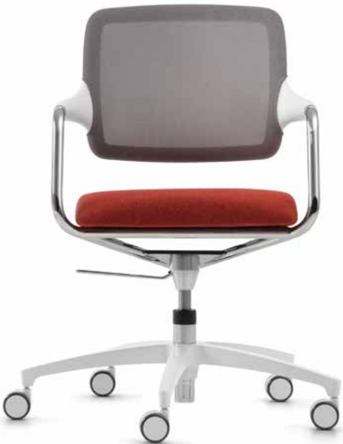
KO 5847 mesh Accoudoirs | Armleuningen AA01KVV

De Kick-off sledestoelen en conferentiedraaistoelen zijn met hun soepele vormtaal een perfecte, stilistische aanvulling op de draaistoelen. De sledestoelen zijn naar keuze niet te stapelen of ook als 3-voudig te stapelen varianten verkrijgbaar - flexibel ruimtegebruik is het resultaat. De conferentiedraaistoelen met standaard armleuningen zijn in zithoogte verstelbaar, en ook naar wens met wielen of glijders uit te rusten.