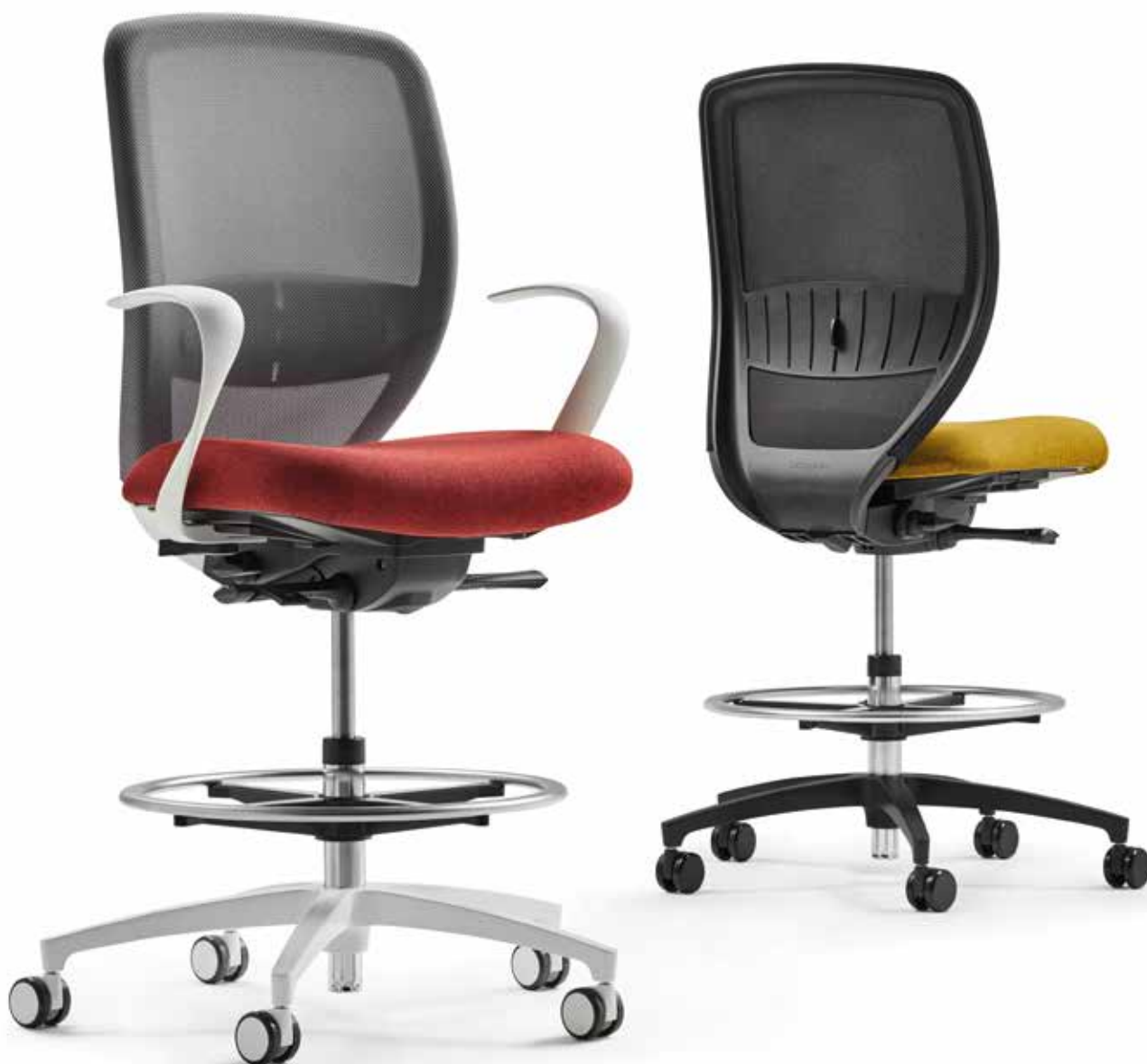
QS KO 5845_CFR mesh + Accoudoirs | Armléuningen A106KVW

Kick-off als countermodel is ideaal geschikt als zitoplossing voor sta- en korte-termijnwerkplekken. Door belastingafhankelijk blokkerende wielen is de stoel indien belast beveiligd en onbelast vrij te bewegen. Glijders bieden als alternatief een absoluut veilige stand. De verchroomde anti-slipvoetring kan gemakkelijk in hoogte versteld worden.