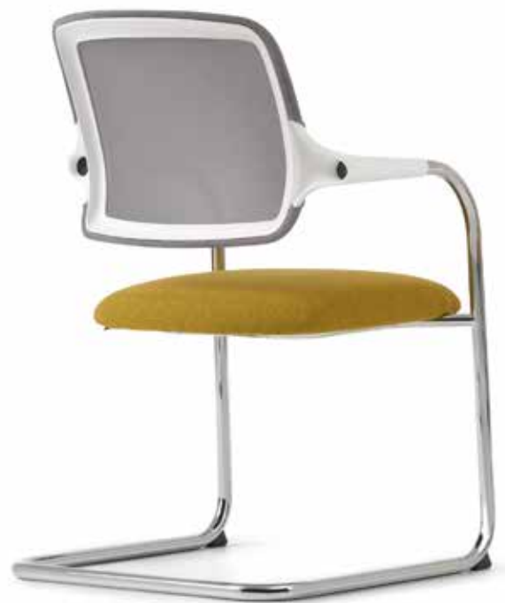
KO 5843 mesh Accoudoirs | Armleuningen AA01KGS